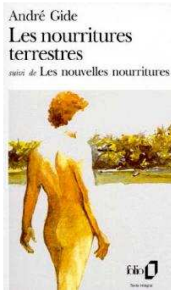
Portada de una edición original de Los alimentos terrestres / terrenales .