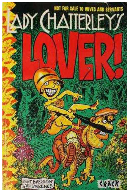
La adaptación al cómic de la obra de Lawrence por Hunt Emerson, tan eróticamente cómicamente divertida.

LV: Yo no sé cuáles son los "requisitos", pero sí podría decir que una obra erótica (no pornográfica) no admite diferencia entre amor y sexualidad, amor carnal y platónico, mente y cuerpo. Una obra que cumpliría los requisitos del erotismo y que a mí me parece fantástica es El amante de lady Chatterley . La novela de David H. Lawrence me marcó profundamente. En la historia hay escenas sexuales explícitas, pero no obscenidad pornográfica. La novela no toma las formas más básicas del sadismo ni busca "decirlo todo", no pretende la transparencia, y el deseo no está consagrado al fracaso o al agotamiento. Creo que esta novela es un paradigma del erotismo en la literatura. Al mismo tiempo, insisto, por mucho que me guste El amante de lady Chatterley , la novela no está por encima de la más procaz de las revistas porno. Por supuesto que en un caso la sintaxis es pobre (porque las novelas o las películas triple X están organizadas en género) y el único fin es la excitación del espectador. Pero ello no les quita mérito. No son obras literarias. No. Las películas no alcanzan la universalidad del arte, cierto. Pero el problema no está en los productos, sino en la comparación erotismo/pornografía. No es un combate justo, desde el vamos.