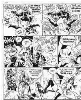
Página de Clara de Noche, de Trillo, Maicas y Bernet.

JMB: ¿Ha sido por ello el erotismo, inherente a determinados de estos personajes, un medio válido para la liberación de lo femenino? ¿Existe un lado femenino del cómic o sólo personajes femeninos hechos por hombres?