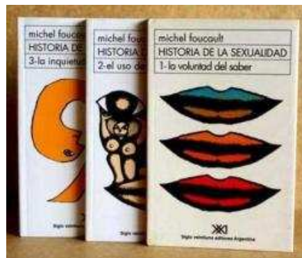
La historia de la sexualidad, por M. Foucault.