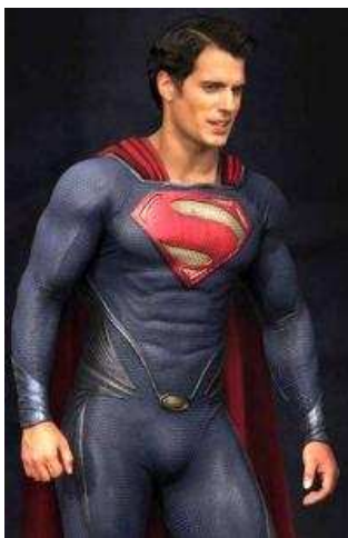
El paquete genital de Superman no se muestra en las historietas.