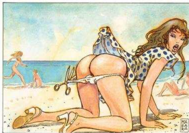
La mujer de Manara ha traspasado el papel de las viñetas para convertirse en un referente del erotismo gráfico. Aquí, una imagen reminiscente de la obra El perfume del invisible .

JMB: ¿Qué personajes femeninos han sido los principales objetos de deseo, a tu modo de ver? ¿Por qué? ¿Qué los distingue de ser meros juguetes sexuales?